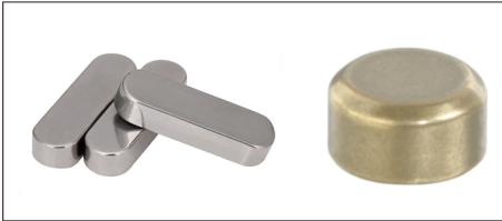
平键 淬火型 PLF03