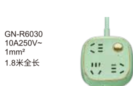
GN-R6030 10A250V~ 1mm 2 1.8米全长