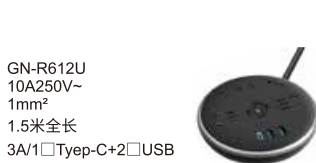
GN-R612U 10A250V~ 1mm 2 1.5米全长 3A/1口Type-C+2口USB USB