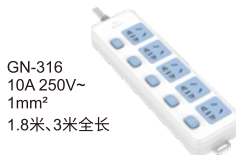
GN-316 10A 250V~ 1mm 2 1.8米、3米全长