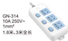
GN-314 10A 250V~ 1mm 2 1.8米、3米全长