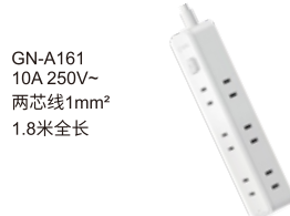
GN-A161 10A 250V~ 两芯线1mm 2 1.8米全长