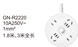
GN-R2220 10A250V~ 1mm 2 1.8米、3米全长