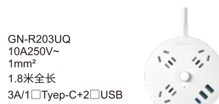
GN-R203UQ 10A250V~ 1mm 2 1.8米全长 3A/1口Type-C+2口USB USB