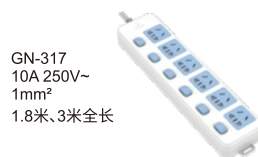
GN-317 10A 250V~ 1mm 2 1.8米、3米全长