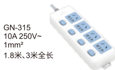
GN-315 10A 250V~ 1mm 2 1.8米、3米全长