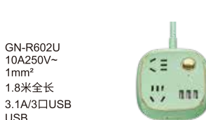
GN-R602U 10A250V~ 1mm 2 1.8米全长 3.1A/3口USB USB