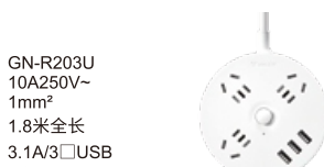
GN-R203U 10A250V~ 1mm 2 1.8米全长 3.1A/3口USB USB