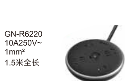
GN-R6220 10A250V~ 1mm 2 1.5米全长