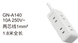
GN-A140 10A 250V~ 两芯线1mm 2 1.8米全长