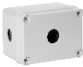
一孔 110×80×70mm JAXG11-01