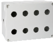
八孔 200×150×100mm JAXG11-08