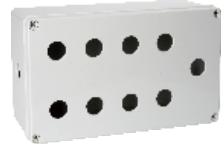
九孔 250×150×100mm JAXG11-09