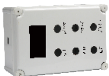
定制款 Custom made button box AG-X