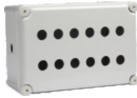
十二孔 280×190×130mm JAXG11-12