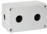
二孔 130×80×70mm JAXG11-02