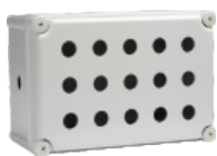
十五孔 280×190×130mm JAXG11-15