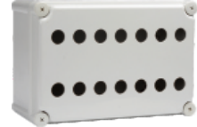
十四孔 280×190×130mm JAXG11-14