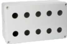
十孔 250×150×100mm JAXG11-10