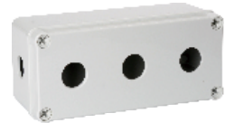
三孔 180×80×70mm JAXG11-03